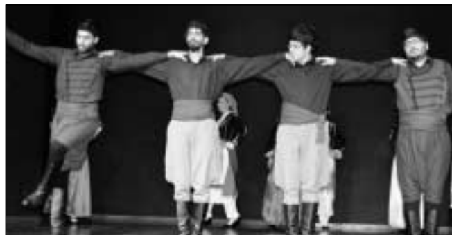
Η ανδρική χορευτική ομάδα