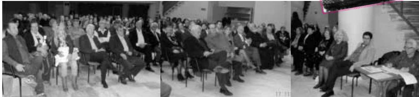
Γέμισε η αίθουσα του Πολυχώρου από Κρητικούς και φίλους