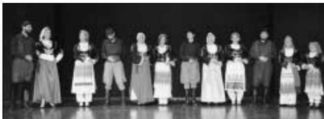
Η χορευτική ομάδα