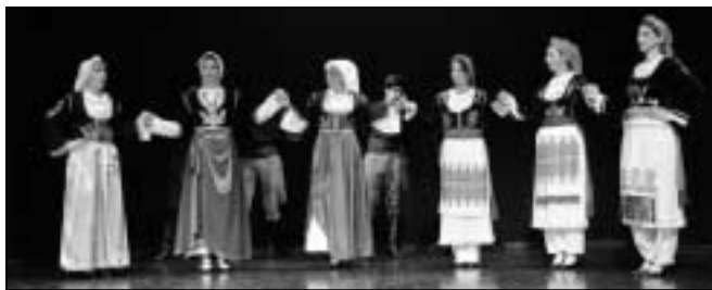
Η γυναικεία χορευτική ομάδα